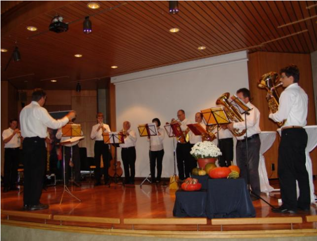
Viel Glück und viel Segen ... begleitet vom Bläserkreis des Evang. Jugendwerks Schwäbisch Hall 🎵 🎵 🎵

Die Schnappschüsse erinnern noch einmal an den schönen Festnachmittag.