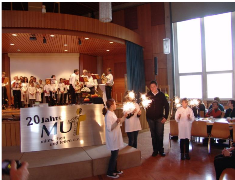
Happy birthday MUT ...

Ich möchte zuerst ein wenig zurück blicken. Die Bilder spiegeln Eindrücke von unserem „Geburtstagsfest“ am 16. Oktober 2010 in der Arche des Sonnenhofs in Schwäbisch Hall, bei dem wir uns über viele kleine und große Geburtstagsgäste freuten.