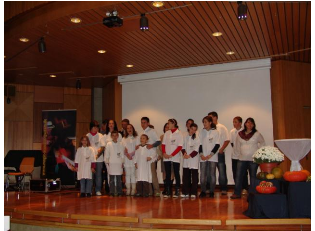
Unsere Bulgaruser bringen ein Geburtstagsständchen